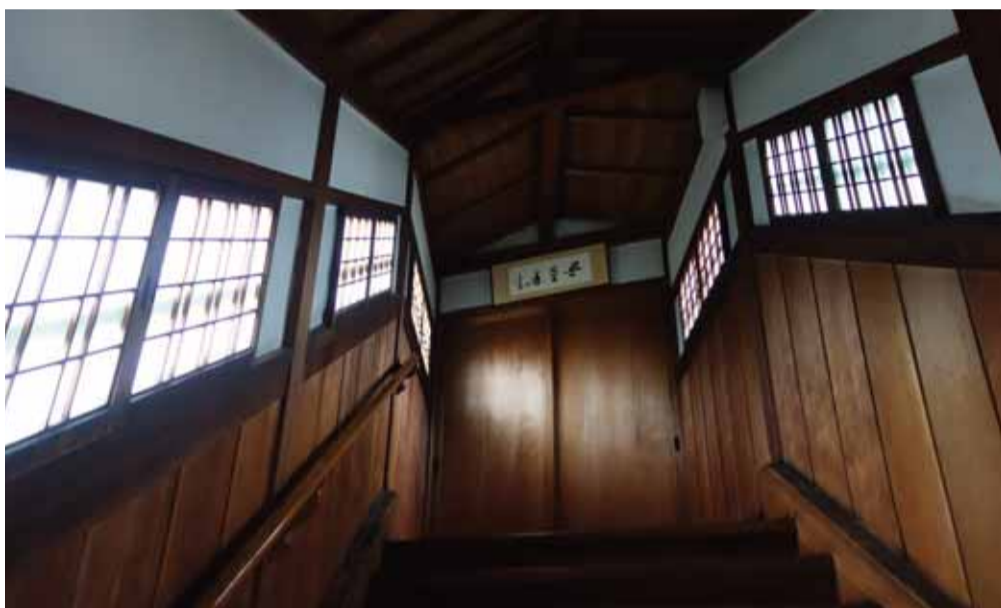
仏間へ通じる廊下は、廊下の形状、窓枠、棧、階段が全て斜め