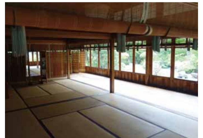
昭和天皇皇后両陛下宿泊の際の寝室として使用