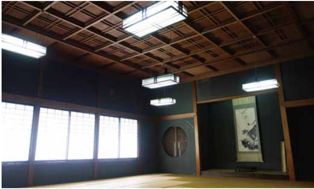
大広間 窓には結晶模様