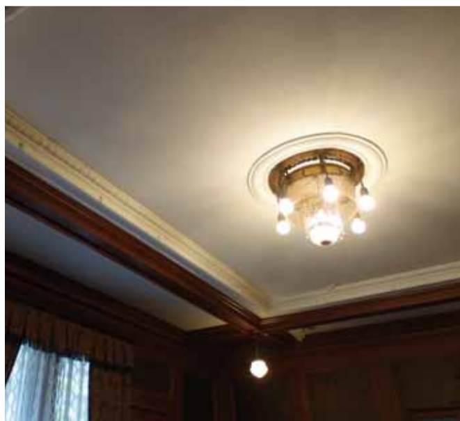
応接室 台輪とシャンデリア