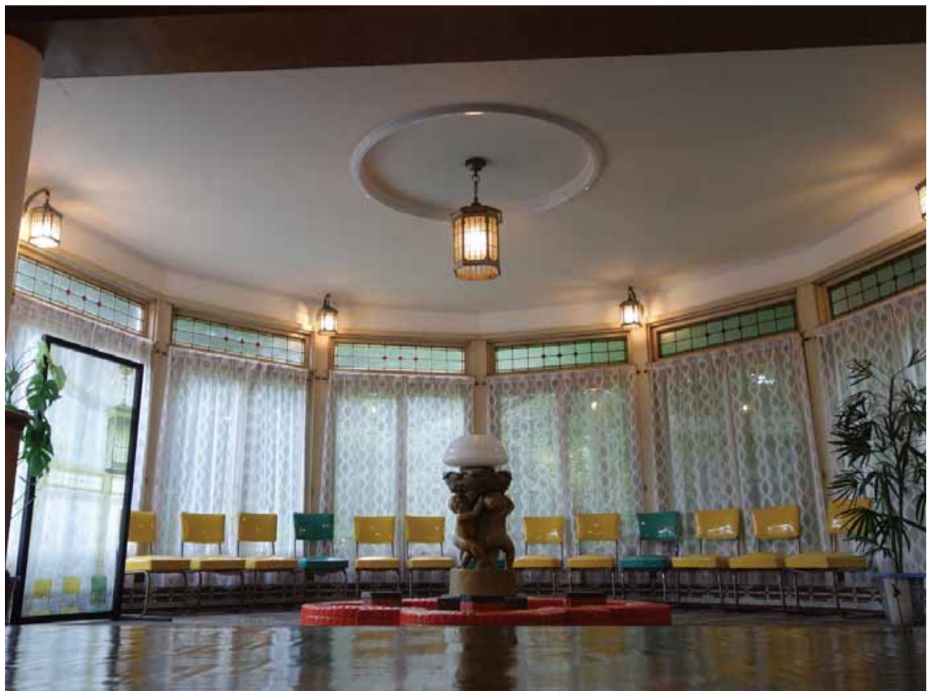
噴水を配した円形のサンルーム