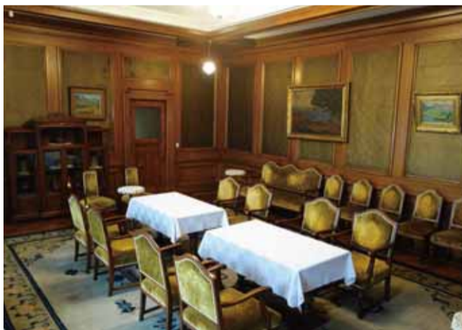
応接室 部屋の4面に配された扉には雷文の象嵌