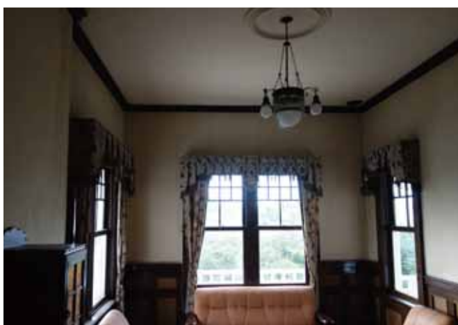
洋室 上げ下げ式で連窓と単層窓