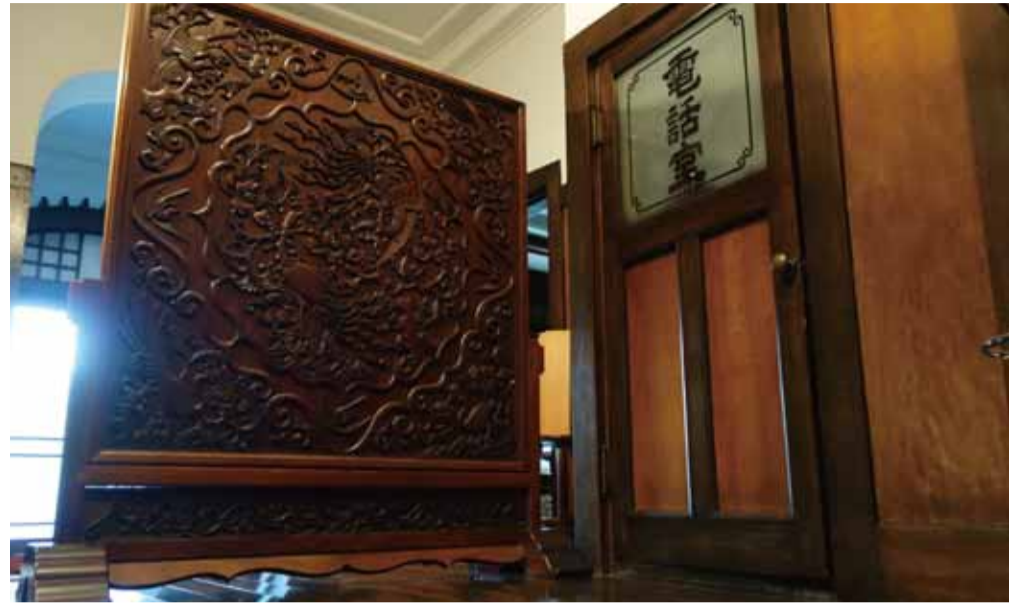
1700年代中国製の衝立と電話室