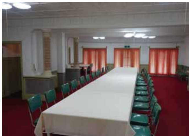
大食堂 漆喰装飾は三角形や六角形等のアール・デコ