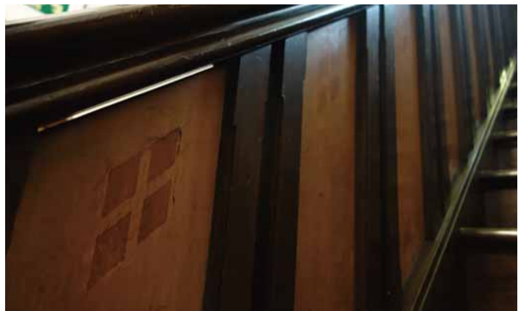
階段 手摺側壁板には菱形象嵌が施され幾何学模様