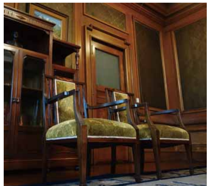
応接室 壁はミズナラ材の額縁飾り