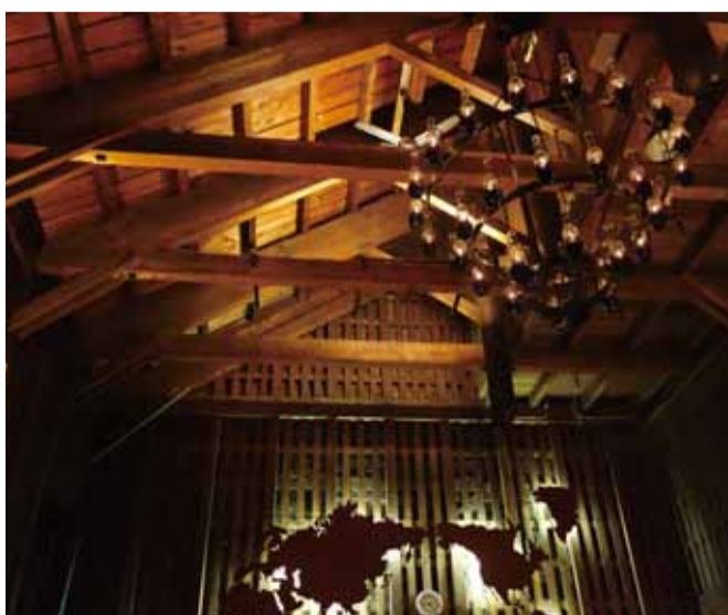
梁を生かしランプをシャンデリアに