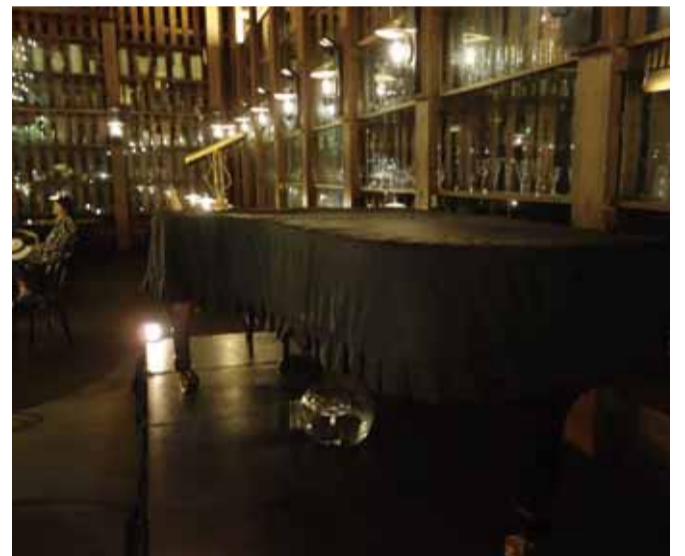
コンサートの臨場感は独特