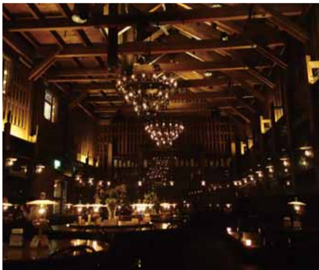
小樽ファンタジックの代名詞

ガラス製品は、手作り感覚を大切にしており、1つ1つ微妙に形が違っていたり風合いが微妙に異なる。基本的に通販はしていない。小樽に来なければ購入できないのが北一硝子の商品。