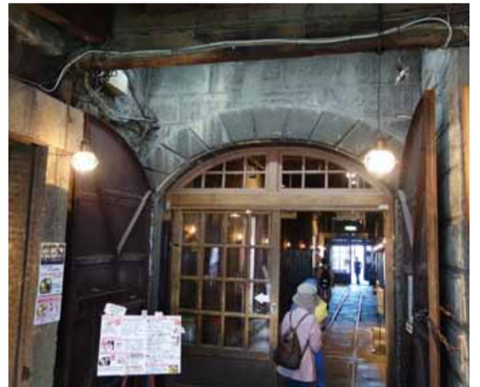
重層感際立つアーチ