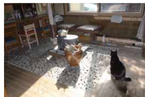
薪ストーブのある居間