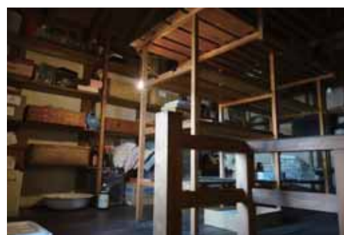
蔵2階収納スペース