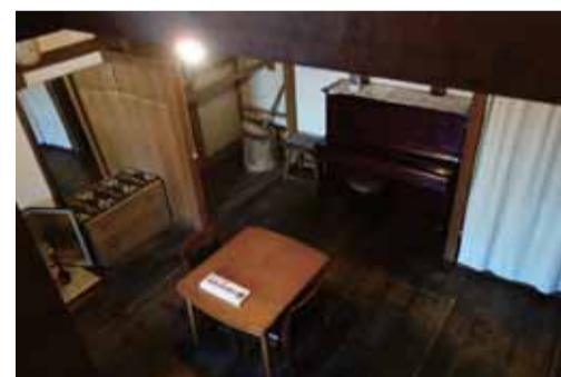
蔵内部俯瞰と表札