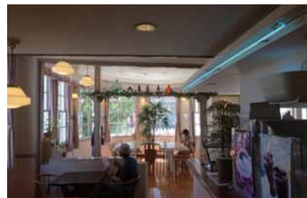
パステル調の店内