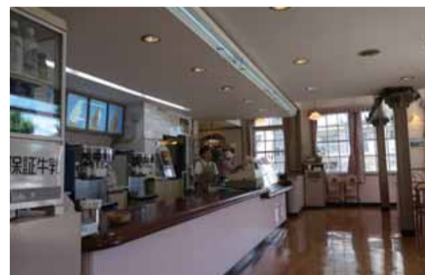
清潔に磨きを欠かさない床