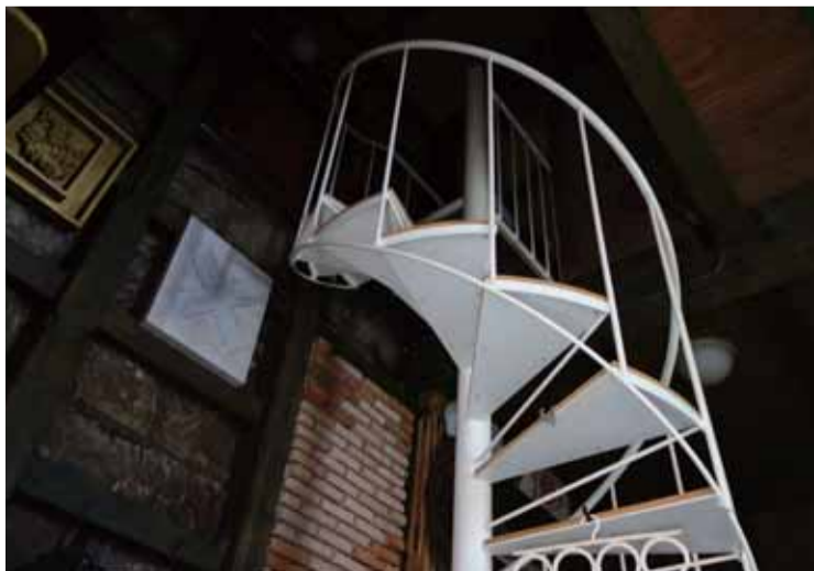
異空間への螺旋階段