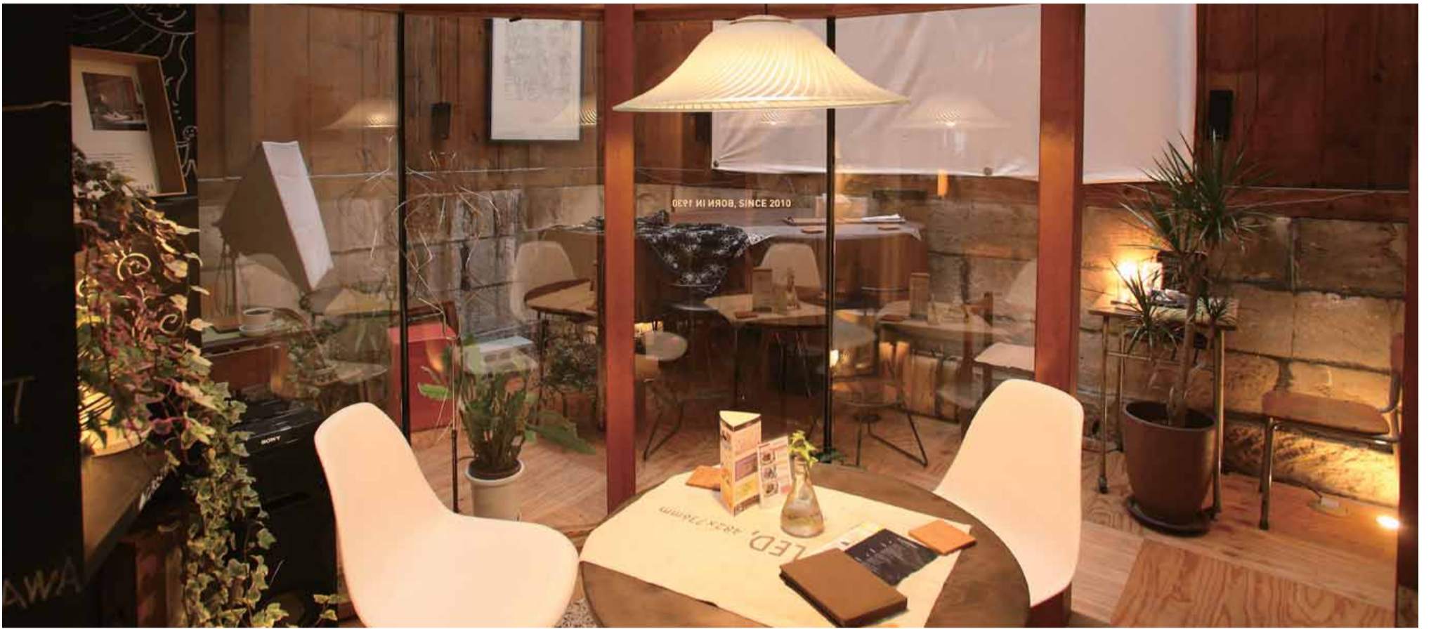
CafeBrown施設内奥にある石蔵スペース・イベントにも