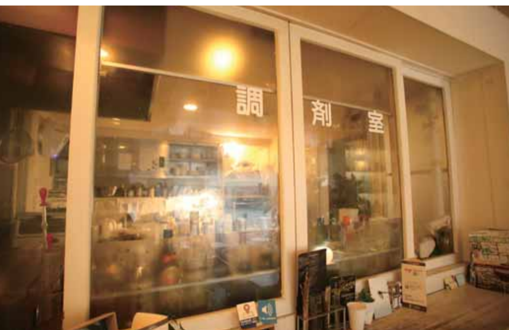
調剤室だった場所を現在調理室として活用