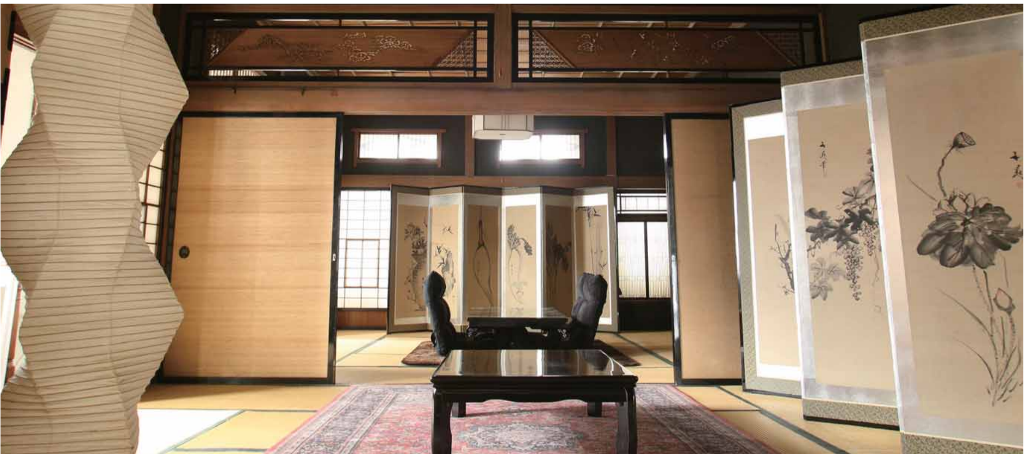
男女別相部屋（最大14名）の和室・宴会や会議などのレンタルスペース