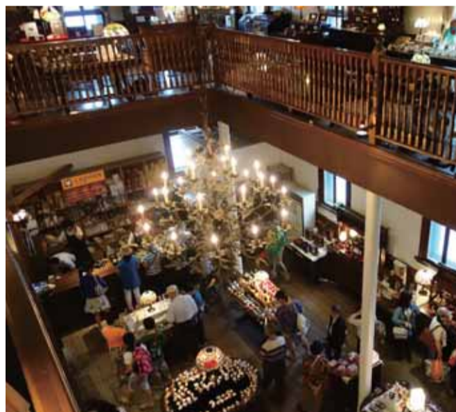
吹き抜けのフロア