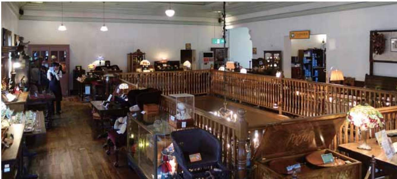
ファンタジーな回廊と2階