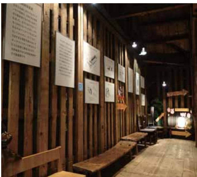
倉庫への連絡通路