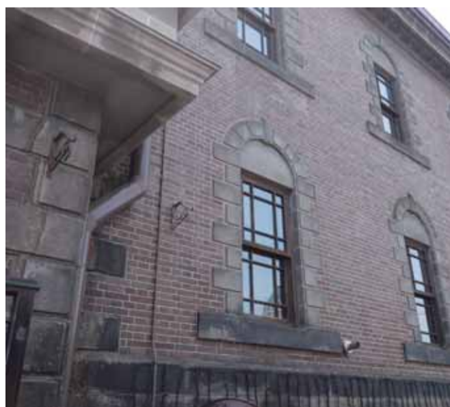
重厚なキーストーン