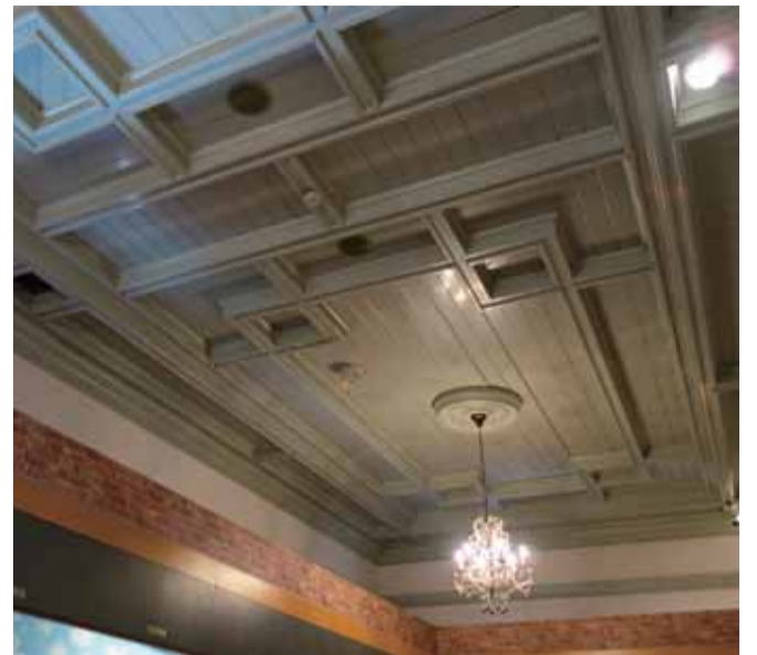
2階の天井飾りと台輪