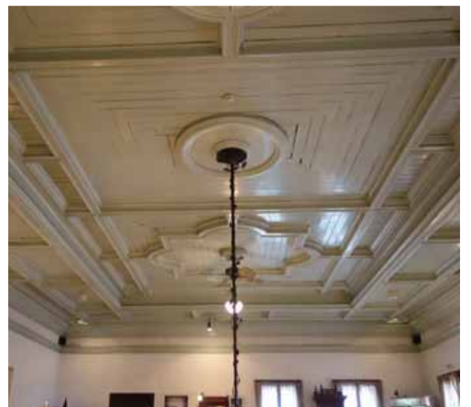
部屋ごとに異なる台輪