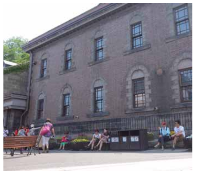
路地で憩う観光客