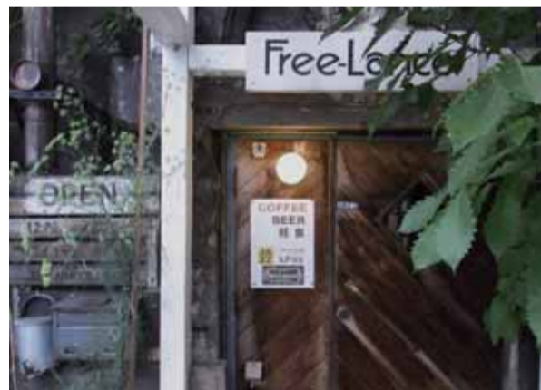
どうぞお入りください