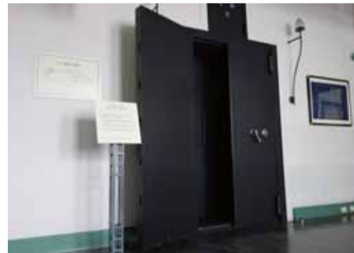
とっておきの金庫室