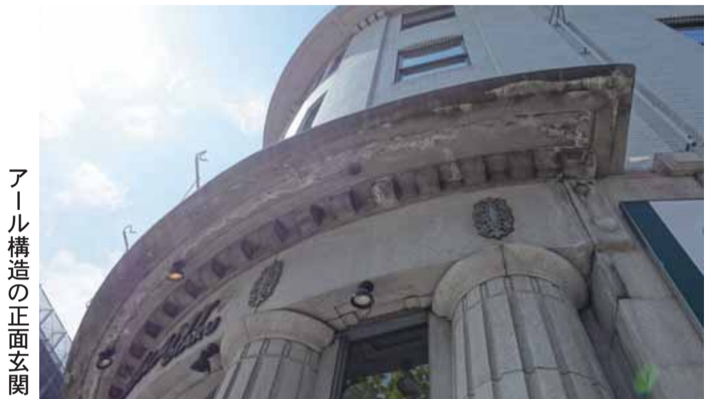
アーチ構造の正面玄関