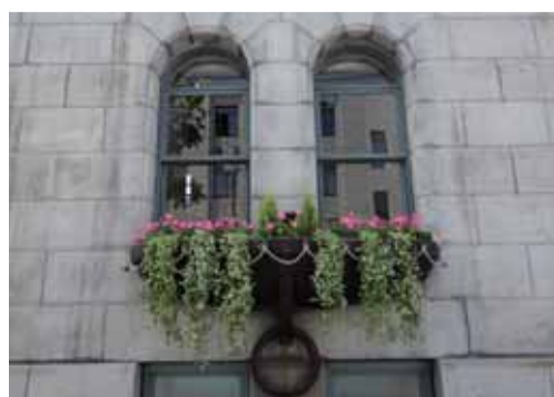
花飾りも欠かさない